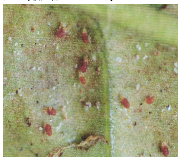
カンザワハダニ寄生状況