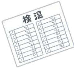
自宅および出勤時の検温