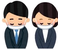
勤務中のマスク着用