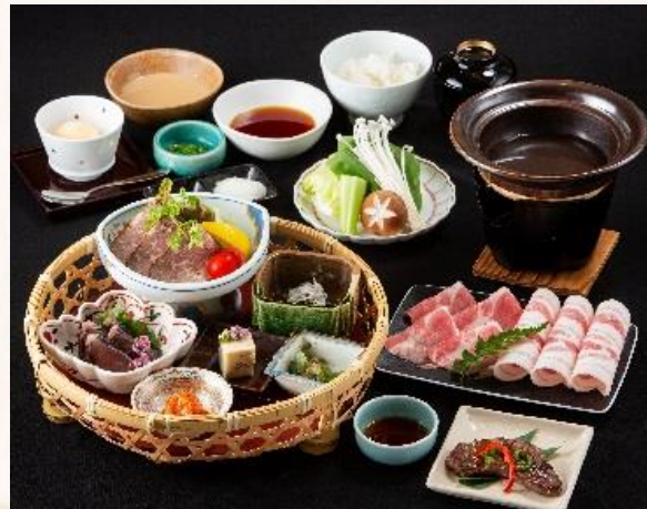
鹿児島黒豚しゃぶ御膳