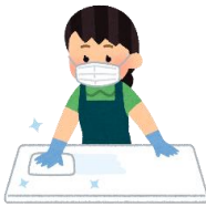
定期的な徹底した 手指除菌と店内消毒

新型コロナウイルスの感染予防対策ご協力につきまして お客様に安心してご利用いただくため、 当店では以下の取組みを実施しております。