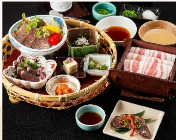
鹿児島黒豚せいろ御膳