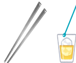
食器類の個別提供