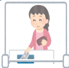
アクリル板の設置