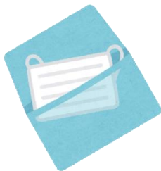
マスクケースの設置