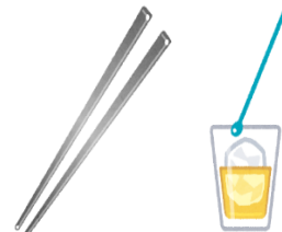
食器類の個別提供